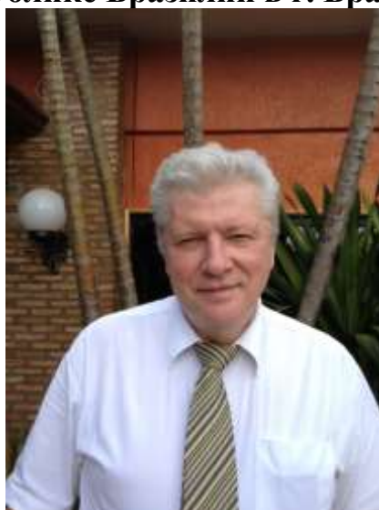
Торговый Представитель Российской Федерации в Федеративной Республике Бразилии С.В. Логинов