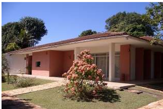
Торговое Представительство Российской Федерации в Федеративной Республике Бразилии в г. Бразилиа